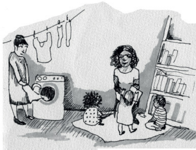
Illustration: Åsa-Rind Strand Hollmer